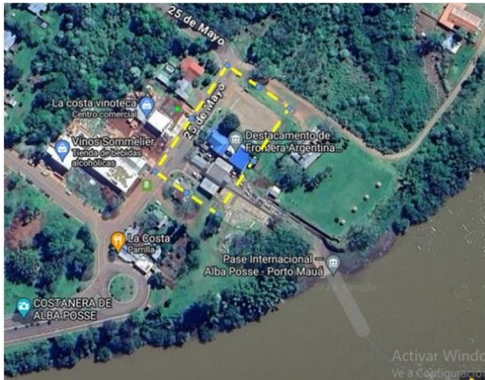
Imagen satelital del Paso Fronterizo Alba Posse, Provincia de Misiones.