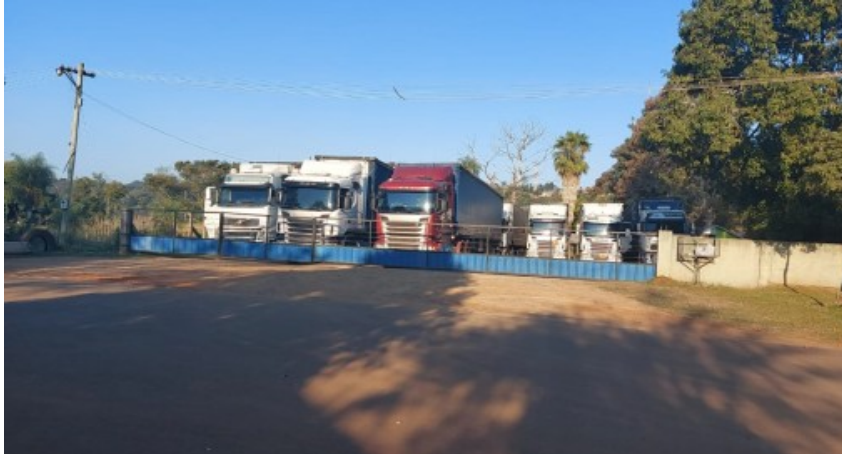
Imagen del ingreso y egreso a la playa de camiones.