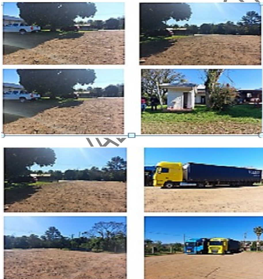
Imágenes internas de la playa de camiones